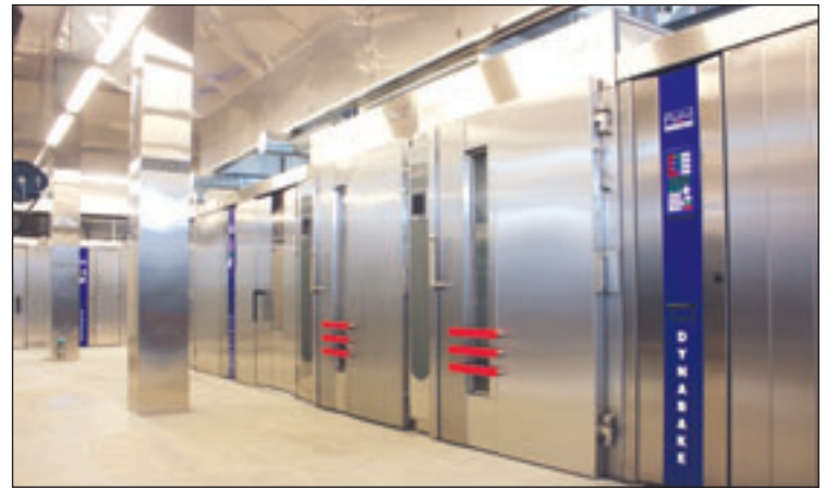
Optimal baking med Dynabake tralleovn og Heuft Thermo-Roll.